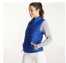
OSLO WOMAN RA5093